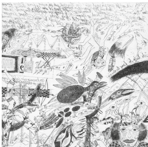
Erhard Wilde Vogelzug | 2003

In Anwesenheit des Künstlers wird die Ausstellung am 9. Juni um 18 Uhr eröffnet. Bis zum Ende des Lyriktreffens am 5. Juli bleibt die Ausstellung für Besucher*innen geöffnet.